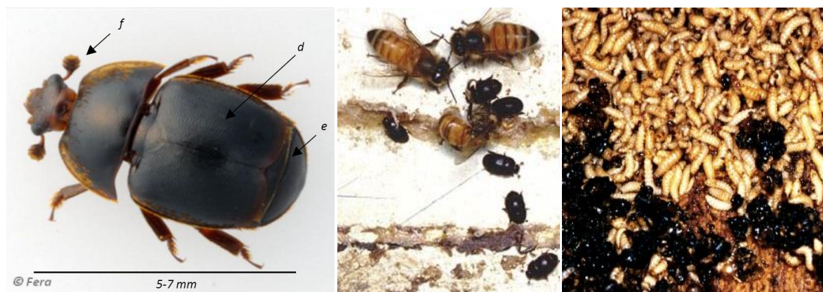
Abb. 4 a-c: a) erwachsener Kleiner Beutenkäfer (links), im Grössenvergleich zu Bienen (b) und c) Larven des Käfers.

Die Käfer findet man meistens in Ritzen und Spalten oder der hinteren Innenseite des Deckels. Deshalb wird ein Anfangsbefall in normal starken Bienenvölkern sehr leicht übersehen.