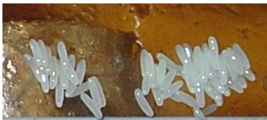
Abb. 2: Eigelege des Kleinen Beutenkäfers

Larven: Die Larve ist das für das Bienenvolk und gelagerte Imkereimaterial schädliche Entwicklungsstadium. Sie wird bis ca. 1 cm lang, ist creme-farben und könnte auf den ersten Blick mit der Larve der Wachsmotte verwechselt werden (siehe Abb. 2). Bei näherer Betrachtung ist sie jedoch durch ihre 3 Vorderbeinpaare (a), Stachelborsten auf dem Rücken jedes Körpersegments (b) und zwei große Dornfortsätze am hinteren Ende (c) leicht von dieser zu unterscheiden.